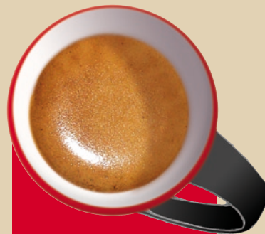
Bild 3: Crema ist schön mittelbraun. Sie soll sich auch bei mehrmaligem Umrühren immer wieder schließen.

Gröber mahlen oder leichter tampen. Kaffeemenge, Wassertemperatur und Pumpendruck kontrollieren (war womöglich zu hoch).